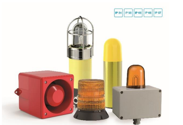
Bild 1: Pfannenbergs große Auswahl an DNV-GL-zertifizierten Signalgeräten eignen sich für eine Vielzahl an Anwendungen mit hohem IP-Schutz