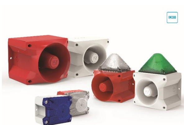
Bild 2: Die DNV-GL-Signalgeräte erweisen sich dank verwindungssteifen Kunststoffgehäusen mit Schlagfestigkeit IK08 als besonders robust