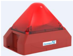
Bild 1: Die PYRA X-L-15 für hohe Industriebereiche bis 15,9 m Deckenhöhe.