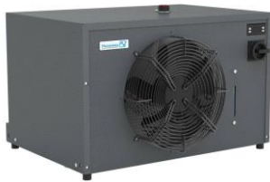
Bild 4: Der Wasser-/Glykol-Chiller PC 2500 ist mit einer Leistung von 2,5 kW auch für den Einsatz in sehr warmen Umgebungen bis +50° Celsius ausgelegt.