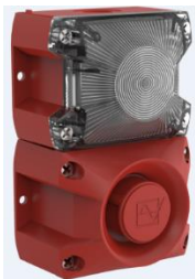
Bild 2: Der Blitzschallgeber PA X 1-05 ist auch für Kleinbetriebe geeignet.